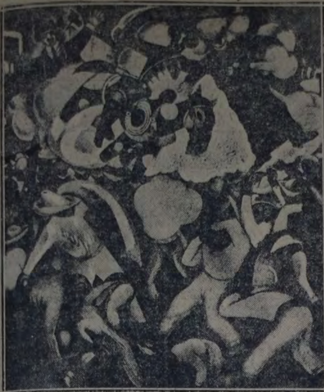
LOS JUDAS. — Decoración de Diego Rivera en los muros del Ministerio de Instrucción Pública y Bellas Artes