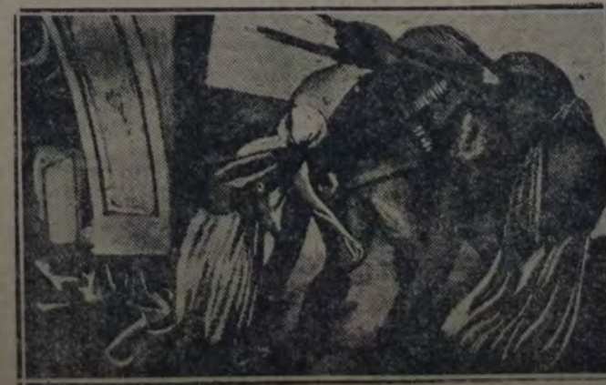
LAS SOLDADERAS. — Decoración de J. C. Orozco en los muros de la Escuela preparatoria de México