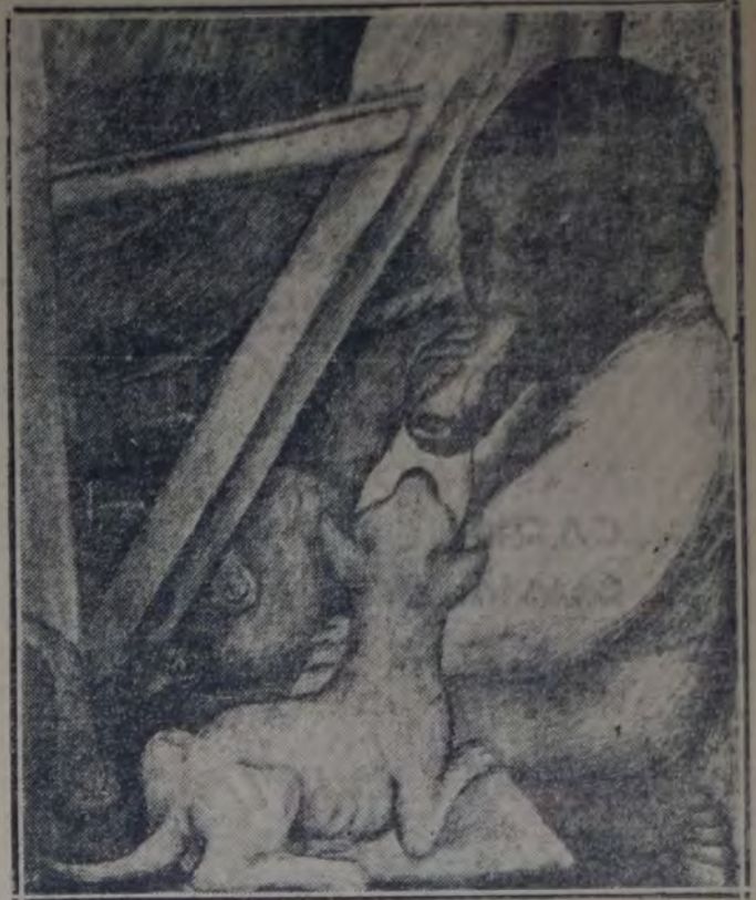
Diego Rivera. — Fragmentos de una decoración en los muros del Ministerio de I. Pública y Bellas Artes