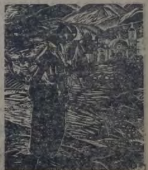
GRABADO, por F. Leal

Encargado de la dirección artística de los niños mexicanos, y partiendo de los atisbos afinados de Adolfo Best, adquiere resultados extraordinarios; y a la vez que agilita las manos de las nuevas cosechas de hombres, los dota de un lenguaje para captar y expresar