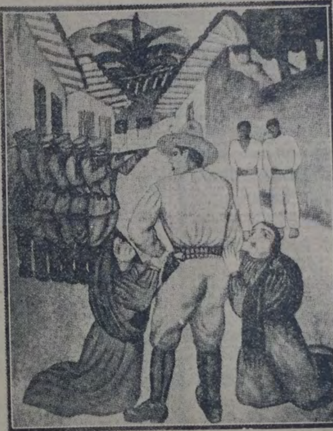
EL FUSILAMIENTO — Oleo de L. Méndez

Y las artes del pueblo: la copia ruda que habla de amores desventurados y exilios; la pintura tosca, la historia heroica o grotesca que se transmite por corridos de generación en generación... Y, como eje, allí en el fondo del Patio de las fiestas, en un gran tríptico, se alzan los rajes pendones del 10 de Mayo, cuyo simbolismo es tan mativo que Diego hace sentir de cien